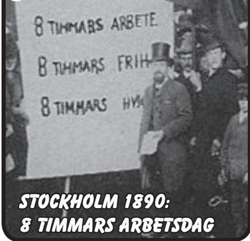
STOCKHOLM 1890: 8 TIMMARS ARBETSDAG