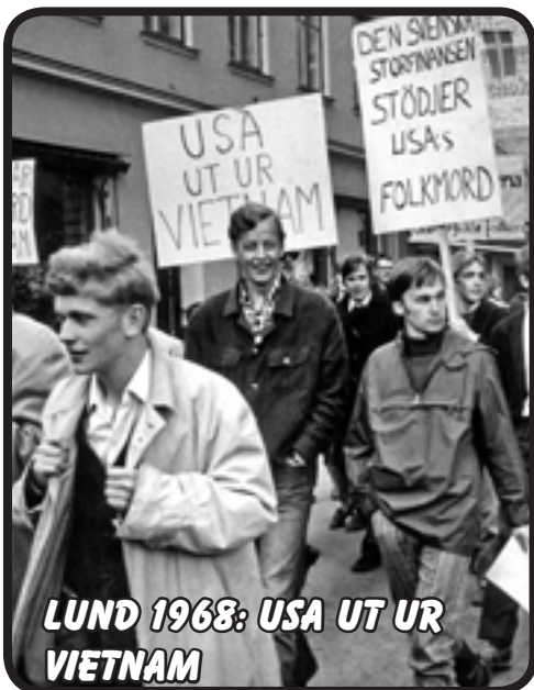
LUND 1968: USA UT UR VIETNAM