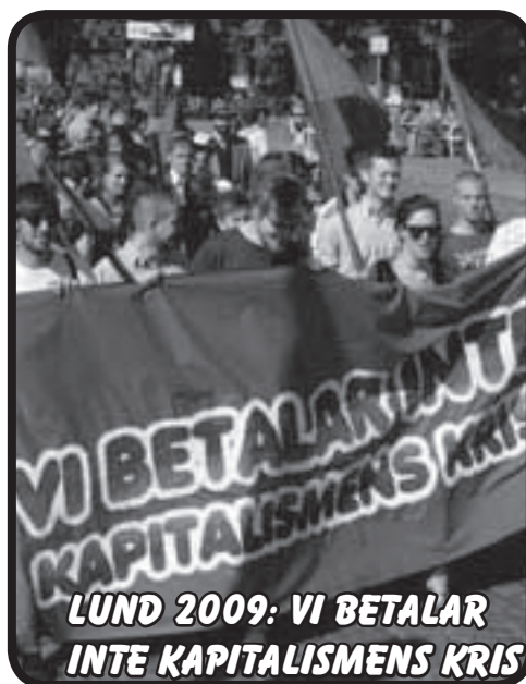
LUND 2009: VI BETALAR INTE KAPITALISMENS KRIS

LUND 2010: KÄMPA TILLSAMMANS! Revolutionär 1 maj demonstration kl 18.00 Knut den Stores Torg. Picknick efferät Mer info: 1maj.net