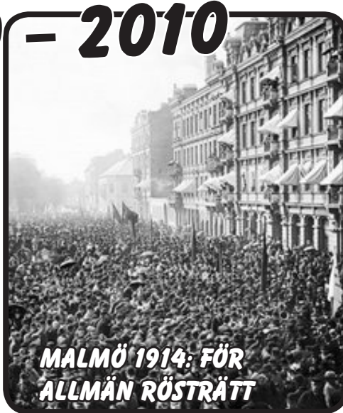
MALMÖ 1914: FÖR ALLMÄN RÖSTRÄTT